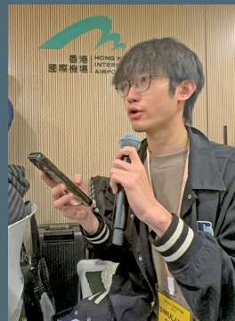
■記者李敖暘向消防署提問（鍾兆佳攝 涉已新聞）