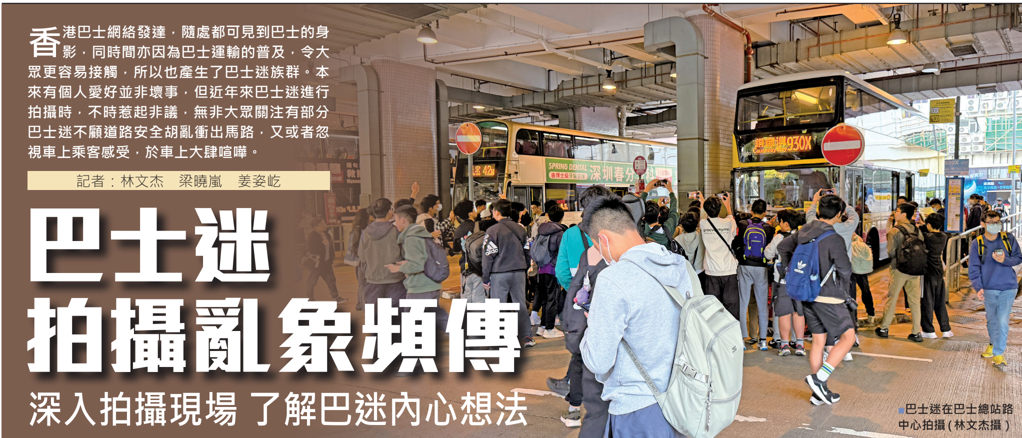
巴士迷在巴士總站路中心拍攝