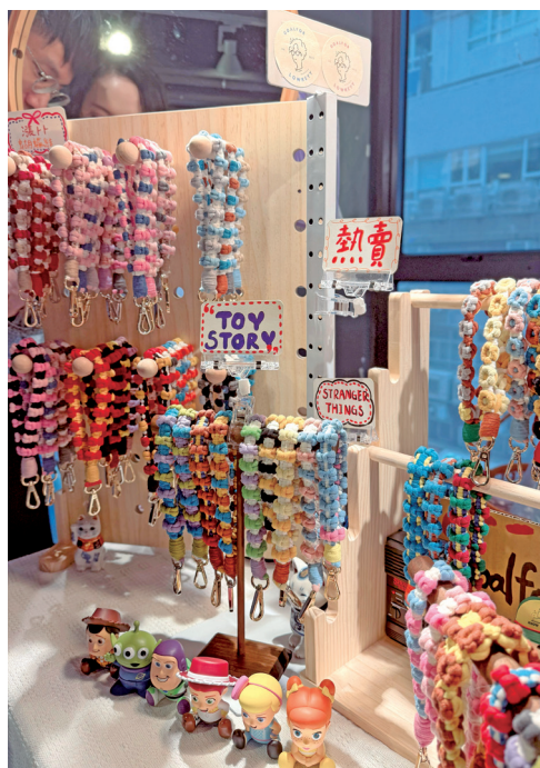
■近年市集成為不少「手作人」嘗試副業的平台，入場成本較低，亦較具彈性

James原本修讀會計及資訊系統相關課程，於大學三年級時因緣際會下認識現時的創業夥伴。當時，STEAM教育逐漸成為教育界的趨勢，二人遂決定共同創立教育公司TURNED-E!，James亦成為公司創辦人之一