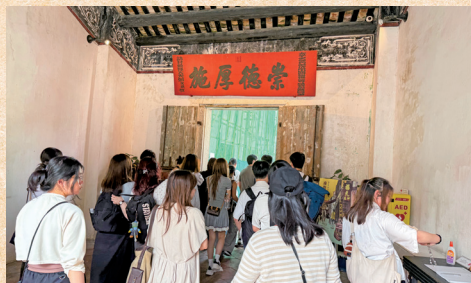
■行程第一站，師生們到「鄭家大屋」參觀，欣賞中西結合的建築特色及了解大宅主人鄭觀應的生平

史城區是中西文化多元共存的獨特體現，是中國城市中極具特色的文化組合。呂博士同時分享了現行的保護措施，以及在保育工作中所面臨的挑戰。