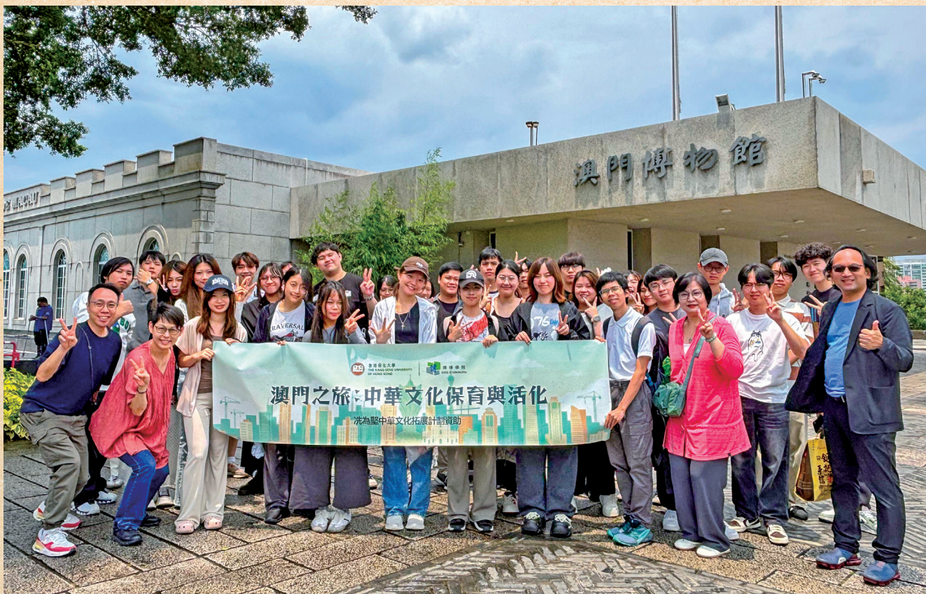
■澳門之旅以參觀「澳門博物館」作結，師生們大合照留念