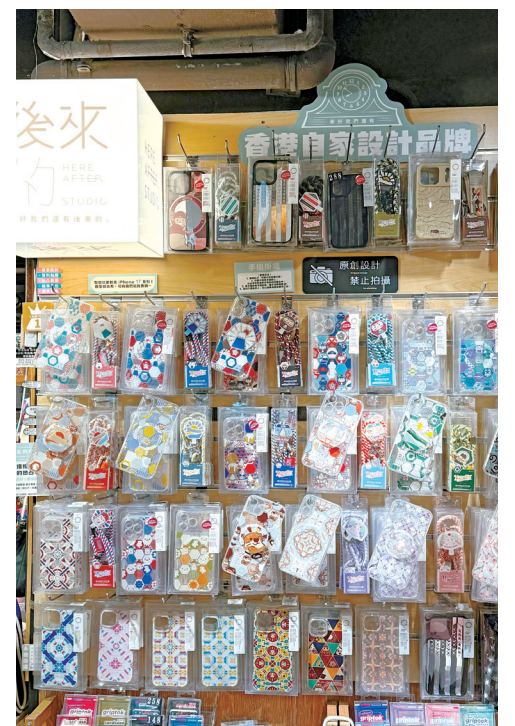
■部分年輕人選擇透過實體店或寄賣方式接觸顧客，降低初期經營風險

談到給年輕人的建議，James直言，與紙上談兵、反覆空想和評估風險，不如實際開始嘗試，因為很多問題只有在真正落手做後才會出現。他指出，創業的關鍵不在於一開始是否想得周全，而是在過程中不斷執行和修正，從實踐中累積經驗。