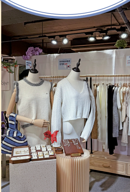
■低門檻的代購模式，讓年輕人可在有限資源下嘗試創業