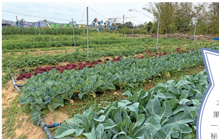
■有機農場內可供採摘的農作物

根據漁農自然護理署的資料，他們一直與蔬菜統營處密切合作，負責收集有機農場蔬菜，並將其運往長沙灣批發市場進行銷售。此外，嘉道理農場暨植物園、香港有機生活發展基金，以及新界蔬菜產銷合作社有限責任聯合總社（菜聯社）也定期在中環及大埔菜站舉辦農墟，為不同農夫提供平台銷售他們的農產品。