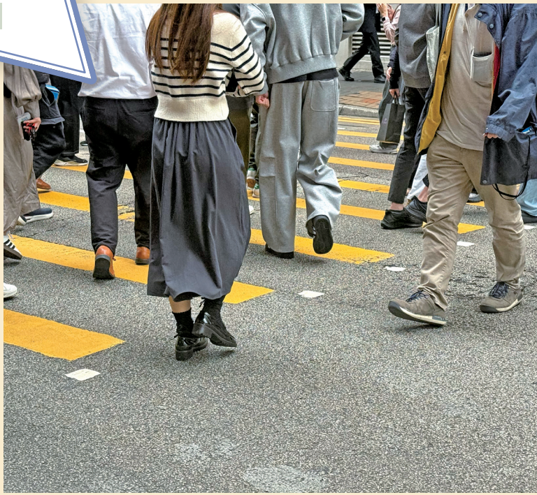
■在就業環境轉變下，部分年輕人開始重新思考傳統就業以外的工作選擇