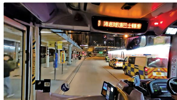
有警車護送 118R 用車至總站

例如於今年 1 月 31 日，巴士公司因應小西灣足球場舉辦賽事而提供 118R 特別巴士服務。當晚警方於危險拍攝黑點，例如海底隧道轉車站，部署相當警力在場戒備，並告誡現場巴士迷切勿在馬路上拍攝。在有關巴士到達旺角時，更有兩部警方電單車「護送」至總站。