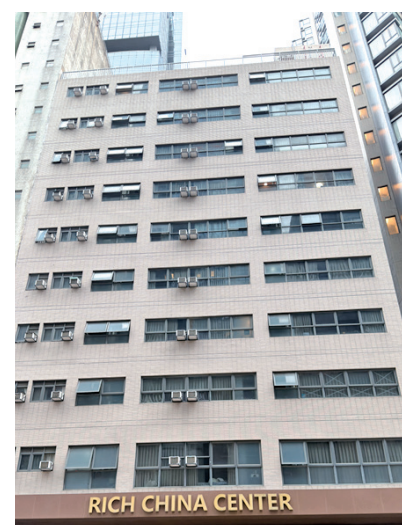
■正在規劃中的城中學生宿舍

未來，隨著香港政府各項住房政策的逐步落地，新增宿位的持續供給，加之高校、市場與民間的協同發力，香港留學生租房市場的供需矛盾有望逐步得到緩解，租房價格偏高、仲介亂象等問題也有望得到進一步規範。