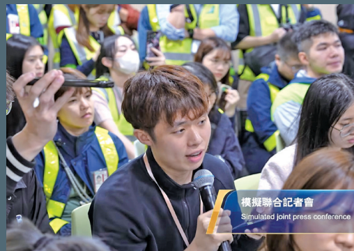
■記者鍾兆佳向機管局、民航意外調查機構對是次意外的成因提出質詢