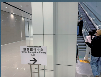
■沒有受傷的旅客被送往設於機場員工綜合大樓的親屬接待中心