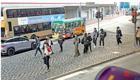
有巴士迷選擇在非行人路位置拍攝，以求有更好角度

下一個最佳攝影位置，甚至選擇在馬路上面跑，但荃灣的街道車水馬龍，不時會上演人車爭路的情景。接近總站時，巴士迷更加砌起一道人牆，由於行人路並沒有足夠的位置，部份巴士迷甚至被迫站於路中心的位置，以求拍攝照片。如此動作，嚇煞車上乘客，有其他乘客亦在車上詢問發生什麼事。