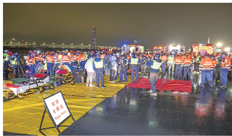
■消防處及香港警務處等緊急應變部門迅即派員抵達事故現場滅火及救援、提供醫療援助、運送傷者並進行其他支援