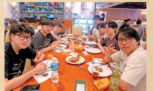
■參觀以外，同學們還有機會品嚐地道的葡國菜，感受一下澳門風味