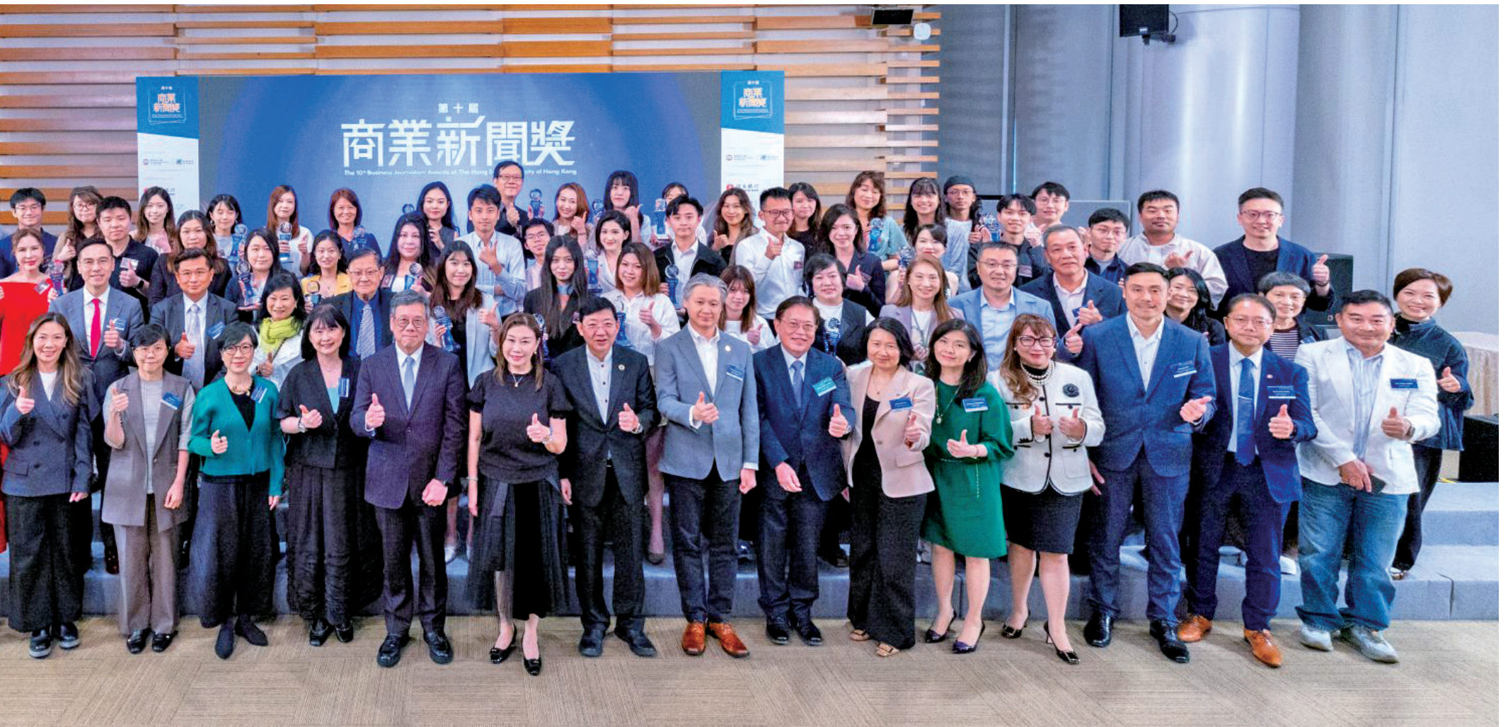
■恒生大學管理層、校董及校務委員會成員與第十屆「商業新聞獎」得獎者、評審以及贊助商合照