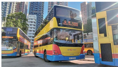
巴士迷張先生（化名）當日到場拍攝城巴 K280UD 行走 930X 路線

巴士迷張先生（化名）當日是其一名座上客，他因看到 K280UD 行走 930X 路線比較吸引，所以慕名前來。當日他由銅鑼灣搭車到荃灣，形容整個車程車內車外都很混亂，車內不斷有巴士迷因拍攝影片問題爭吵。在巴士到達荃灣時，更有巴士迷在巴士抵達愉景新城時胡亂衝出馬路，他認為巴士迷可以在更安全的位置中拍攝，例如天橋。