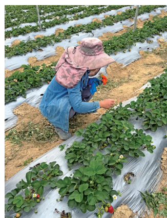
■梁太在清除農田裏的雜草（姜姿屹攝）