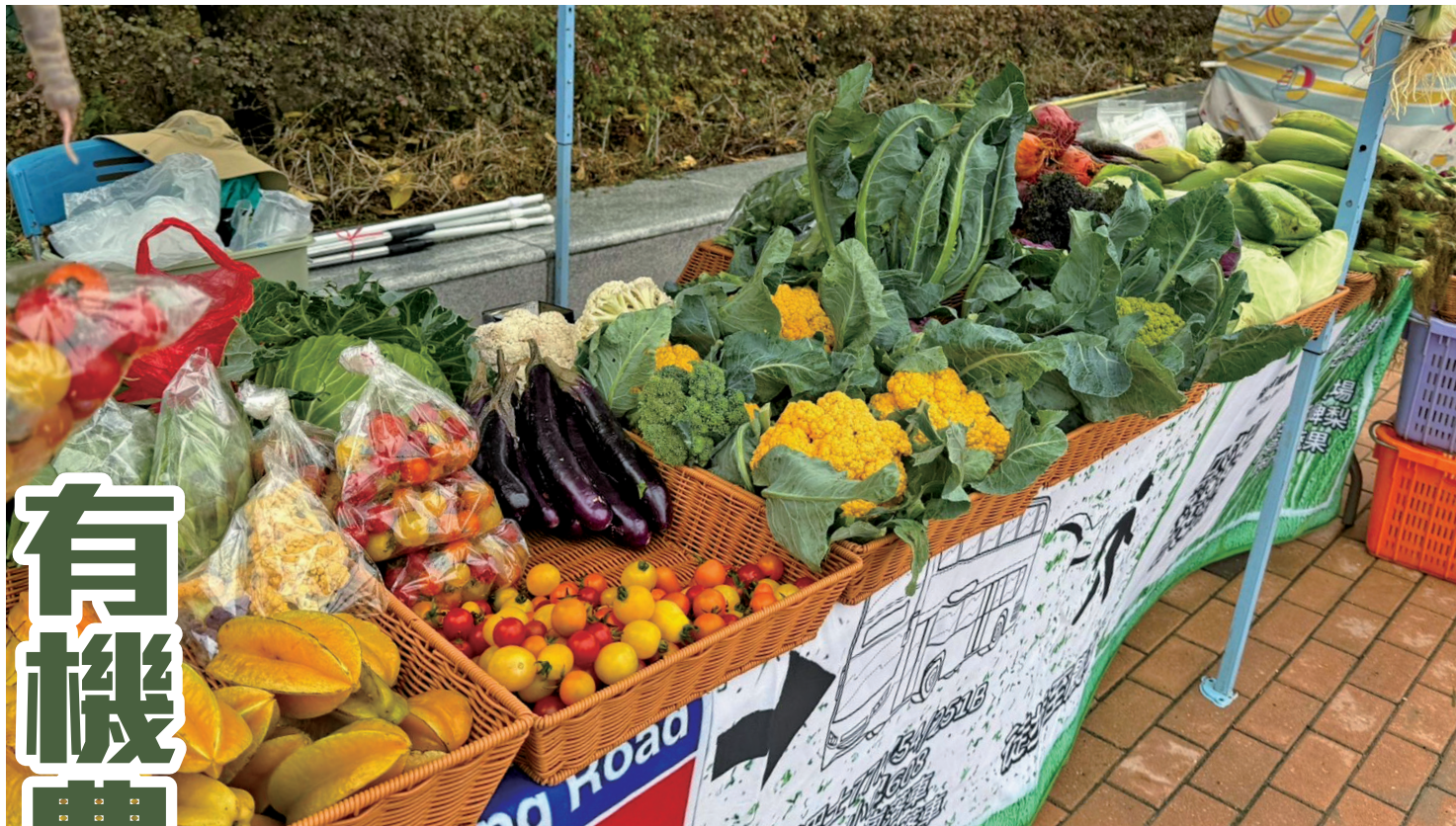
■農夫於農墟擺賣