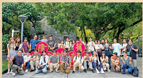
■同學們參觀「益隆炮竹廠」舊址，了解澳門二十世紀傳統炮竹業的發展

透過兩天的實地考察，學生在專家與導賞員的分享下，深入理解了文物保育、活化與社區記憶之間的緊密關係。是次澳門考察不僅讓同學走出課室，將課堂知識與實際場景結合，亦讓大家親身體會中華文化在澳門這片中西交匯之地，如何被保存、再利用與傳承。除了帶回澳門的手信與特產，不少同學亦笑言「滿載而歸」，對中華文化有了更深一層的認識與體會，為今次學習之旅劃上圓滿的句號。