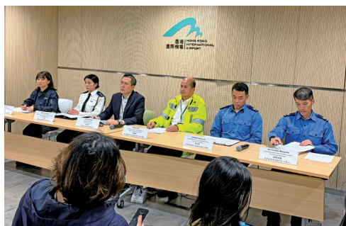
■機管局聯同航空公司、消防署、警務處等政府機構的模擬聯合記者會

演習於凌晨2時15分開始，模擬大灣區航空一架波音737-800航班HB9999，由香港國際機場飛往日本青森，因機艙服務員報告一名乘客放於座位下的外置充電器冒煙，在中跑道滑行時中止起飛，客機在減速期間輪胎爆裂，導致滑出跑道，並停於中跑道北面滑行道，其起落架繼而塌下並起火。航空交通管制指揮塔人員發現後啟動飛機失事警報，機管局亦即時啟動機場緊急應變中心，以助不同政府部門、機場同業和機構協調及溝通。消防及警方立即到場進行救援，提供醫療援助、運送傷者及進行其他支援。大灣區航空啟動家屬聯絡中心，為乘客家屬提供協助。